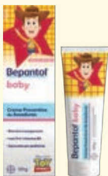
Bepantol Baby Toy Story Creme | 120g | cód. 752690