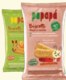
Biscoito Papapá 60g | Todos os tipos